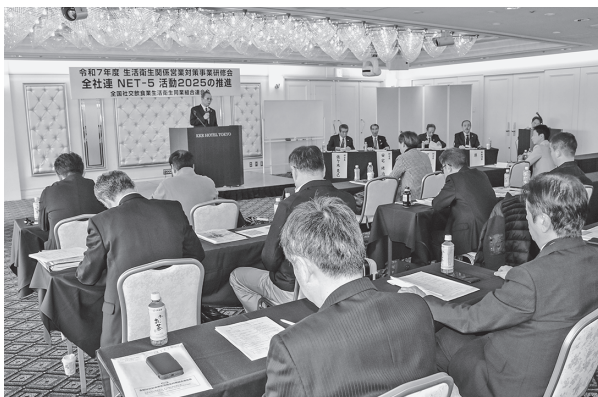
2日目は全社連幹部による講演が行われた