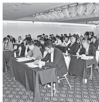
講演に聞き入る参加者

2日目は最初に「NET-5活動2025の具体的な手続等」について岸久副会長兼専務理事が説明した。NET-5は令和7年度第3回理事会で決議されたもので、令和7年度末までに各道府県組合が今年度の組合員数を維持しながら5%純増（7年度補助金事業実施5都県：宮城、山梨、東京、岐阜、愛知は10%純増）を目標に取り組み内