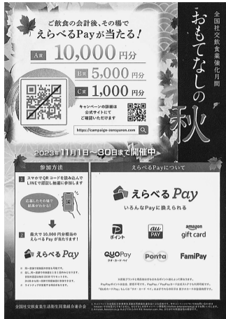
抽選用POPと公式サイトの二次元コード(左下)

「おもてなしの秋」参加できるが、同一店舗での抽選は1日1回のみ。キャンペーン期間11月1日(水)午前零時~11月30日(木)23時59分 実施の流れ(店舗) お客様来店時、キャンペーンを実施中の簡易告知をする。飲食をお楽しみ頂く。会計時、お客様に「抽選用POPと公式サイトの二次元コード」を渡す。 抽選の方法(お客様) 抽選用POPの二次元コード(店ごとに異なる)をスマホで読み込みLINEをスマホで読み込みLINE E認証を行う。E表示される案内に従い簡単なアンケートに回答。抽選ボタンを押し抽選に参加。その場で結果がわかり当選の場合「えらべるPay」の電子マネーポイントが受け取れる。 ※えらべるPayは様々なスマホ決済サービス、決済アプリ、ポイントのポイントを自由に選べる。