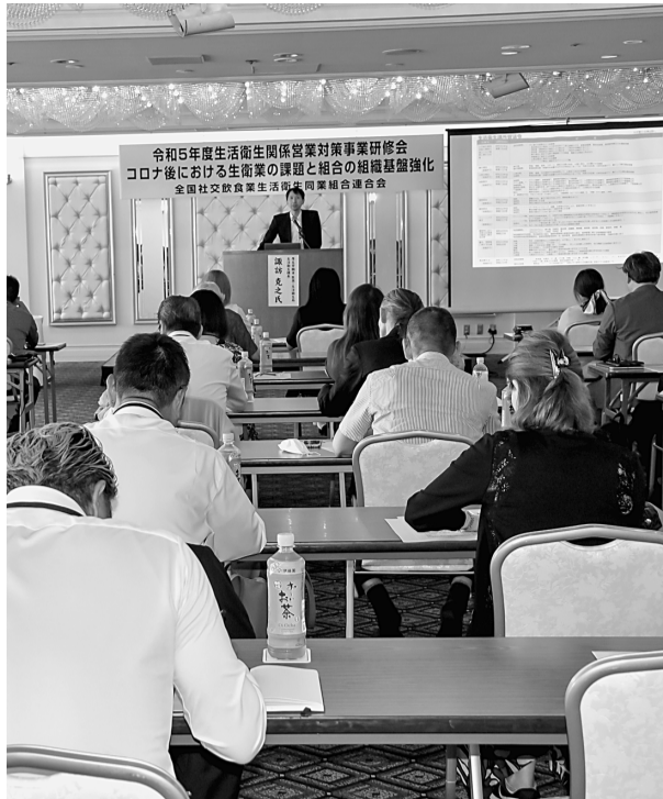
諏訪氏の基調講演を集中して聴く参加者